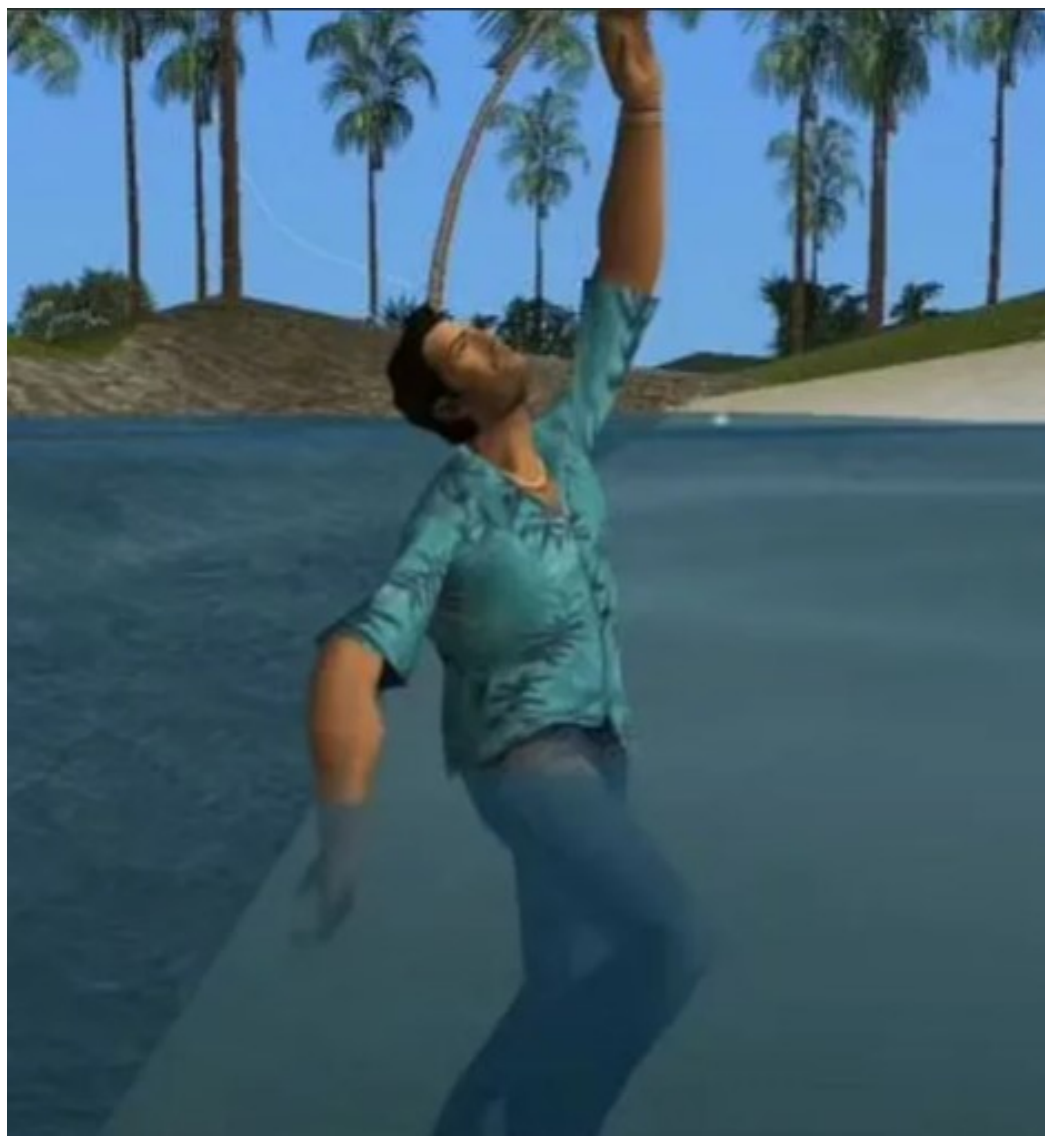
Рисунок 4 – Grand Theft Auto: Vice City

Одним из самых известных методов ограничения является вода – «вода» (17 %). В играх, где действие разворачивается на островах, безграничная водная гладь способна остудить пыл игроков, желающих выйти за пределы игровой локации. Он использовался в легендарной серии игр Grand Theft Auto в жанре action-adventure от третьего лица. Перед игроком простирается остров с различными активностями, за пределами которого находится бесконечный непреодолимый океан. В старых частях Grand Theft Auto III и Grand Theft Auto: Vice City главные герои просто по замыслу разработчиков не умели плавать (рисунок 4), что превращало попытки сбежать с острова в прямой путь к загрузочному экрану. В последующих частях протагонисты научились покорять морские просторы не только брасом, но и на различных экземплярах водного транспорта, что заставляло разработчиков из Rock Star сделать океан бесконечным и населённым кровожадными акулами, а транспорт – выходящим из строя после некоторого времени движения в направлении от главной локации.