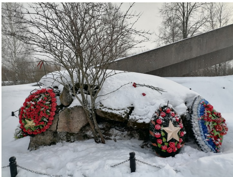
Фото 5 – Разрушенный дот Александра Типанова в 80-ю годовщину полного снятия блокады Ленинграда 27.01.2024 (личное фото автора)