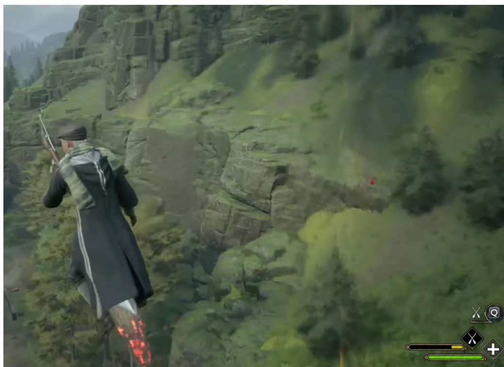
Рисунок 2 – Hogwarts Legacy