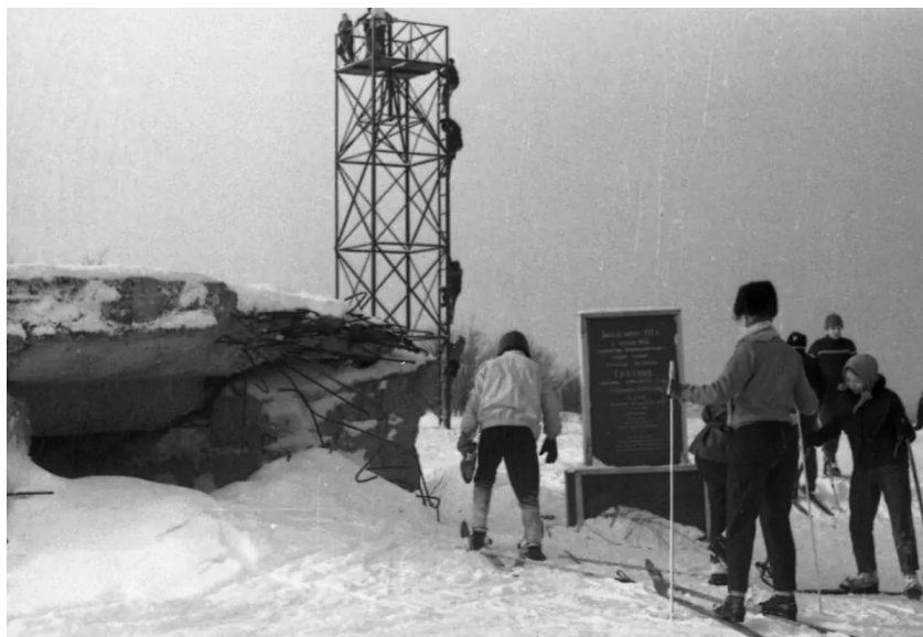
Фото 4 – Лыжники у Дота Типанова, конец 60-х годов XX века

разрушенном состоянии и в 60-е годы был увековечен памятной доской и небольшим обелиском (фото 4) [см.: 6].