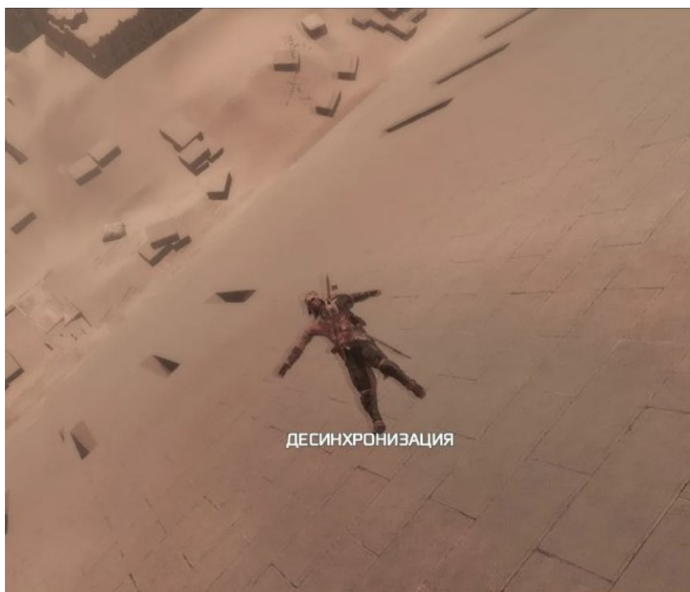
Рисунок 3 – Assassin's creed III