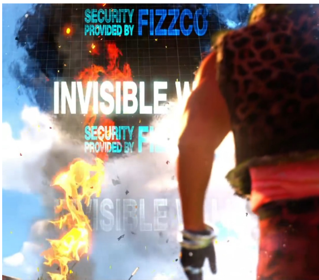
Рисунок 1 – Sunset Overdrive

магическим барьером (рисунок 2), поставленным преподавателями для лишения учеников возможности покинуть территорию школы без их ведома.