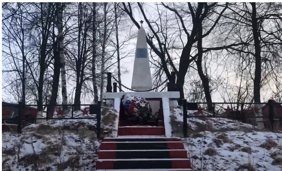
Фото 2 – Памятник воинам 42 армии 1941–1944 рядом с деревней Большое Койрово (личное фото автора)

В районе урочища Верхнее Койрово одно из ответвлений лыжни примерно на 240 м уходило влево и подходило к небольшому памятнику воинам 42-ой армии, братской могиле, в которой захоронены 8 неизвестных воинов, защитников Ленинграда (фото 2) [см.: 3].